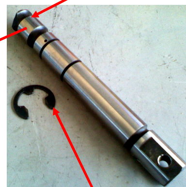
4008.013.016.00.0 Anel elástico 19 6799