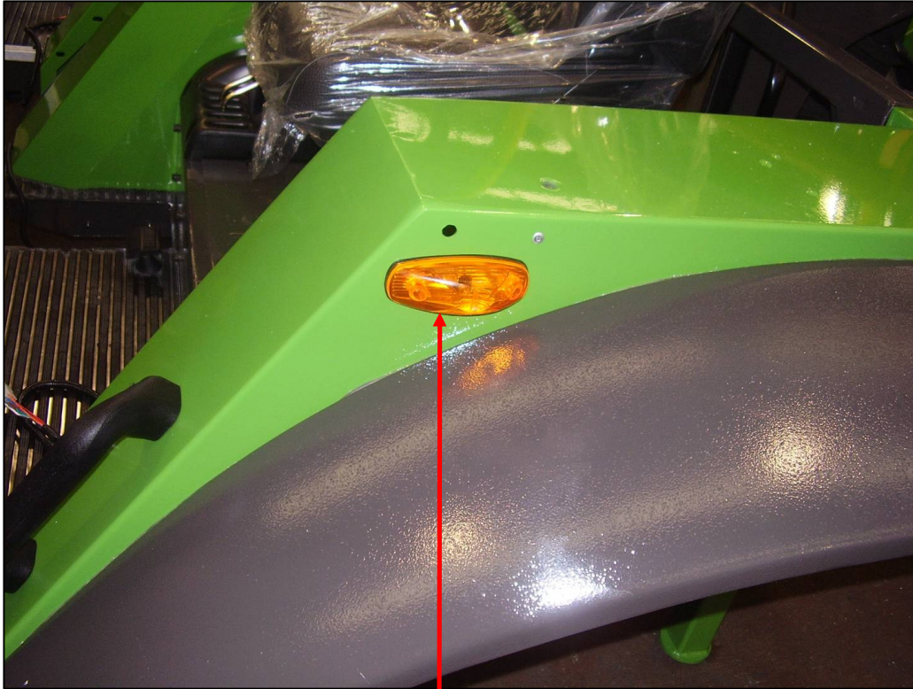
6009.011.013.00.5 Cj lanterna do pisca lateral