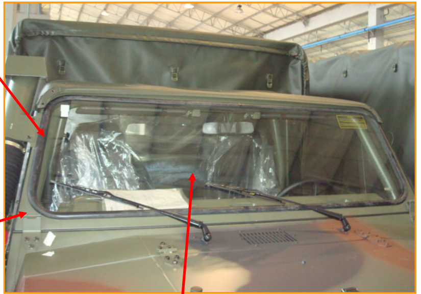
6011.013.583.00.1 PARA-BRISA LAMINADO INCOLOR